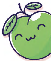
TABLA DE PUNTUACIÓN

Una partida de "Pares" no tiene ganador, solo un perdedor. En cada ronda, los jugadores se turnarán para robar cartas hasta que una persona decida retirarse o consiga una pareja. Cualquiera de estas opciones da puntos, y los puntos son malos. El primer jugador con cierta cantidad de puntos pierde.